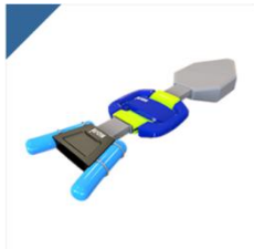
2.大面積自動化油回収機