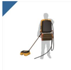
3.リュックサックタイプ油回収機