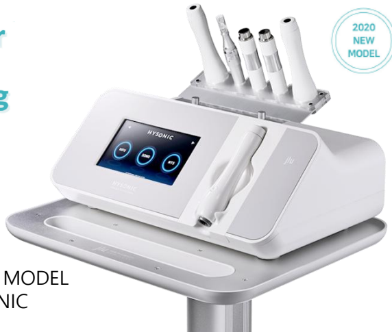
2020 NEW MODEL HYSONIC

HIFUでSHAPEで一度、DUAL SONOでLIFTINGで一度、DUAL HIFU SONOで完璧に仕上げます。